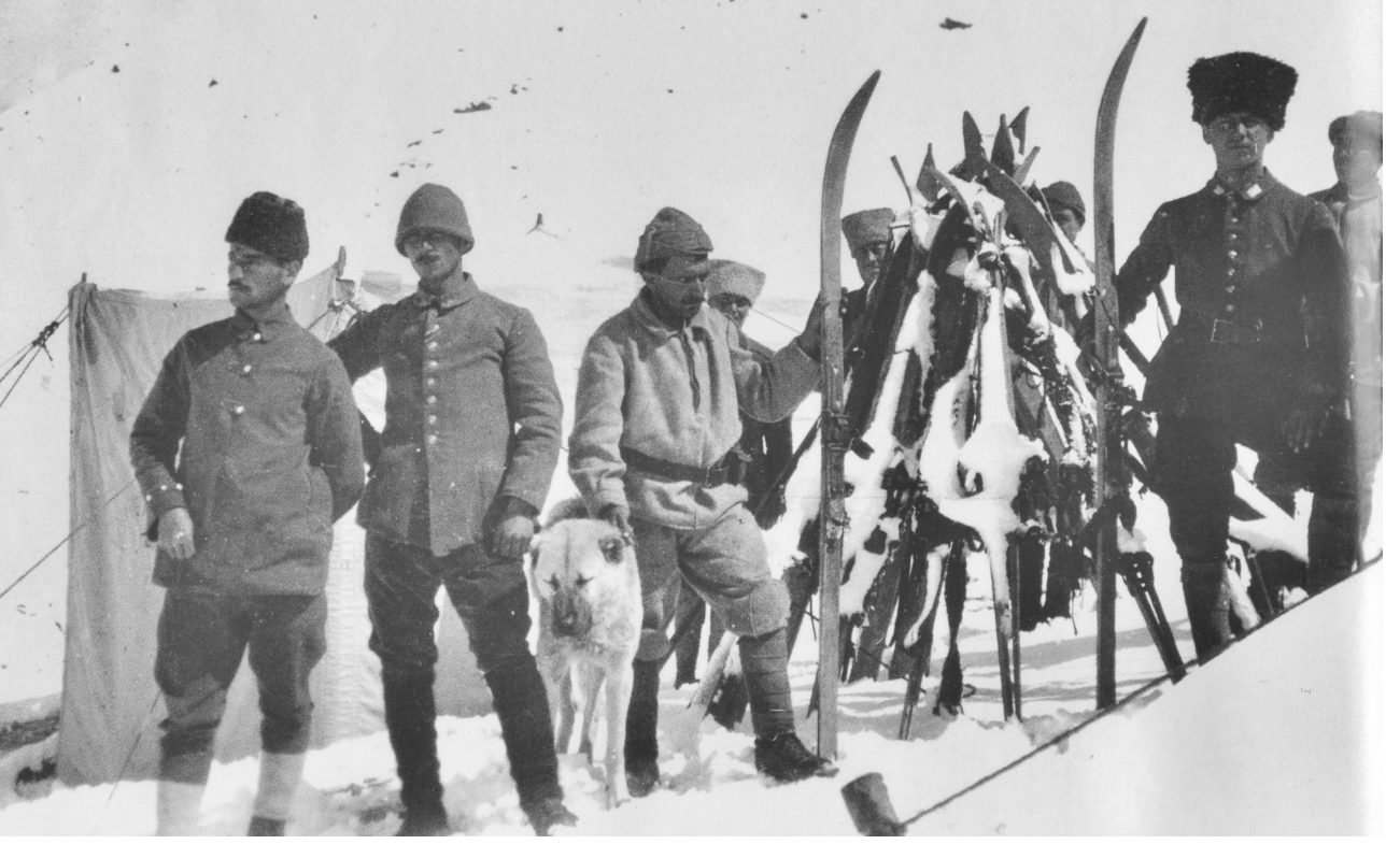
Kafkas cephesinde osmanli bir kayak birliđi